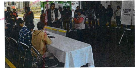
Imagen 2. Recepción de la votación.