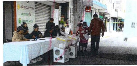
Imagen 1. Integración de la mesa directiva.